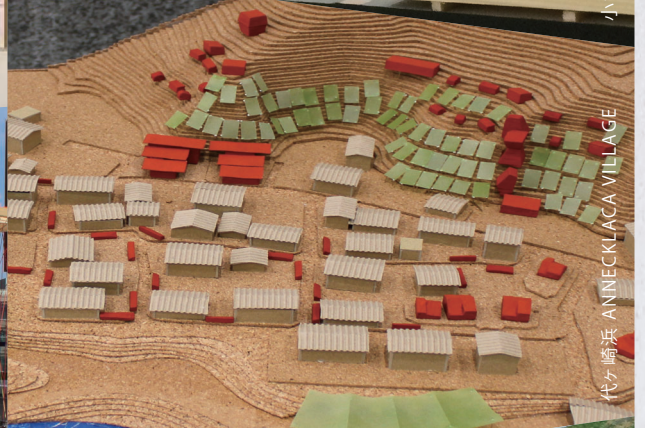
代ヶ崎 英 ANNEKLACA VILLAGE