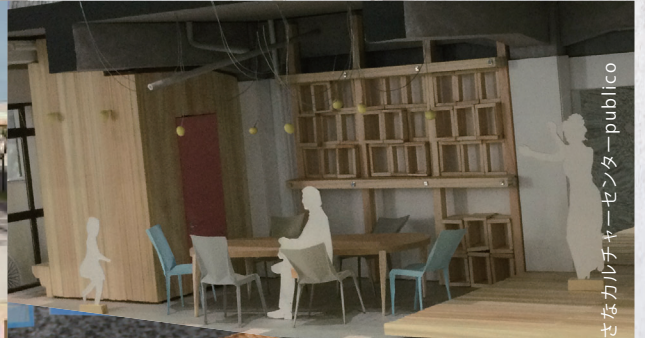
小さなカナルチャーセンター-publico