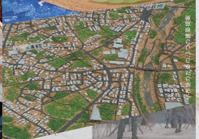
小布施のための、3つの建築提案